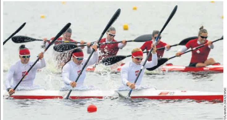
Kajakowy Puchar Świata rozgrywany był w Poznaniu ostatnio w 2013 roku